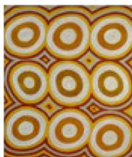
Rêve des deux femmes.