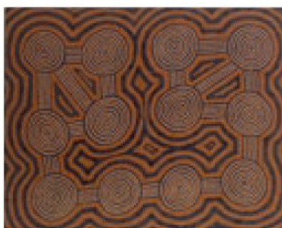
Cycle Tingari.